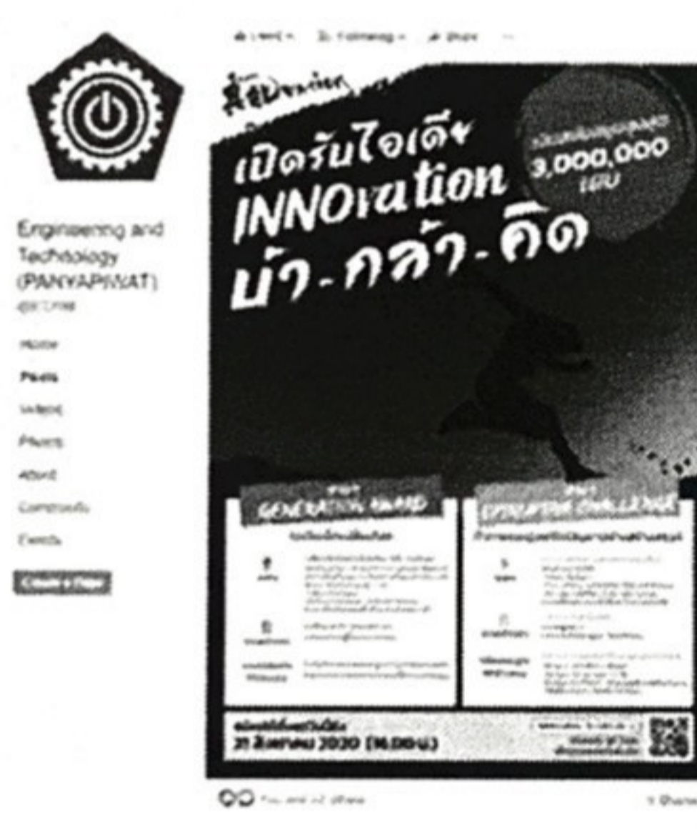
FB | PIM