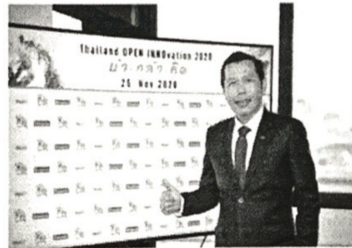
ศาสตราจารย์ ดร. วรวิทย์ อรรถนรินทร์ ... ได้รับรางวัลชนะเลิศ ...