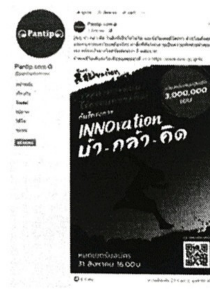
FB | Pantip.com