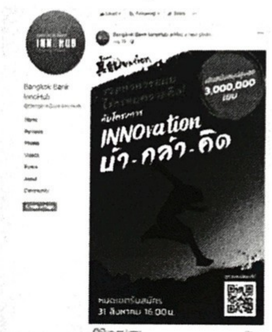
FB | InnoHub