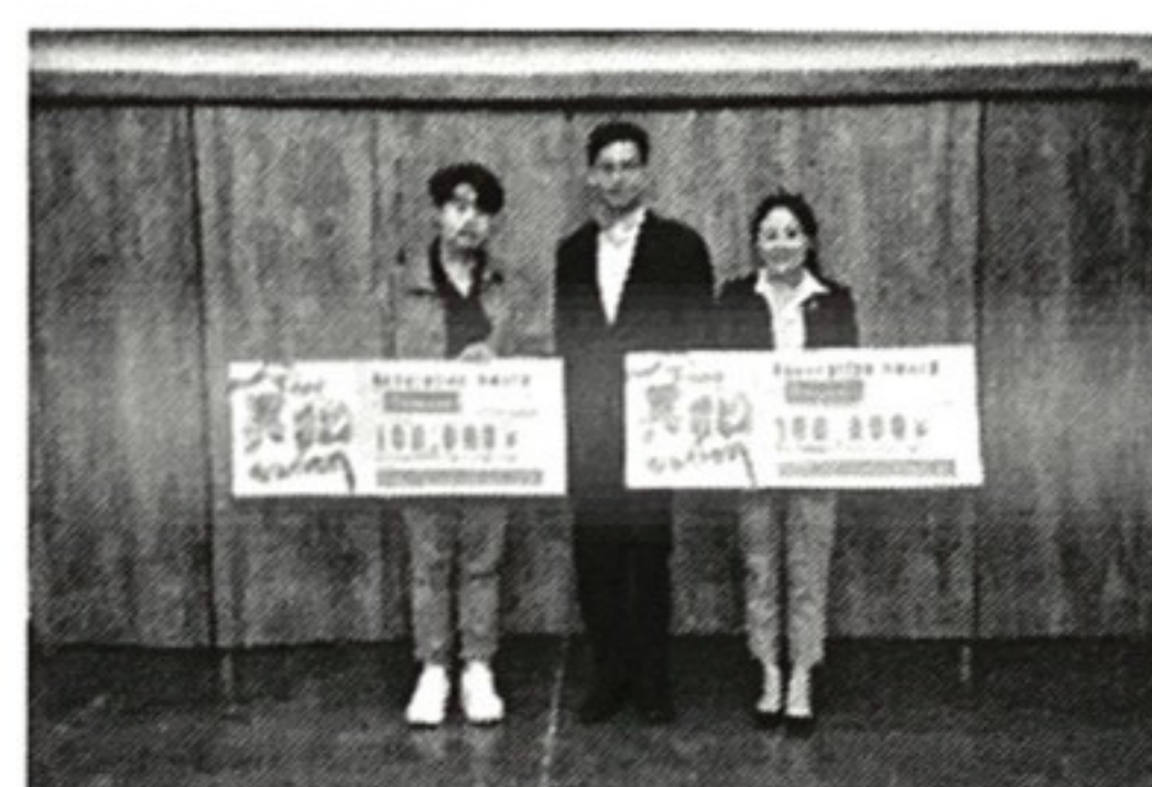
ผู้ได้รับรางวัลจาก BBL