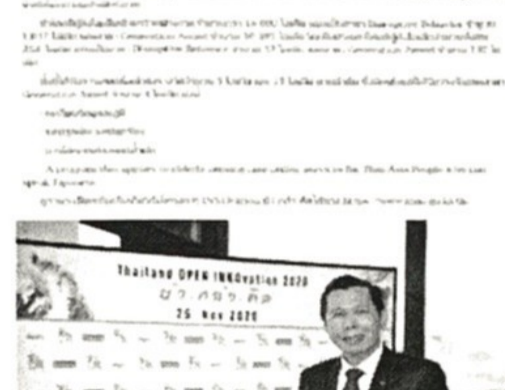
ทีมพัฒนา บริษัทดีเวลอปเปอร์กรุ๊ป ... ได้รับรางวัลชนะเลิศ ...