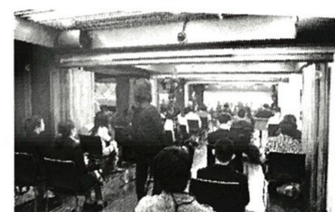
บรรยากาศภายในงาน