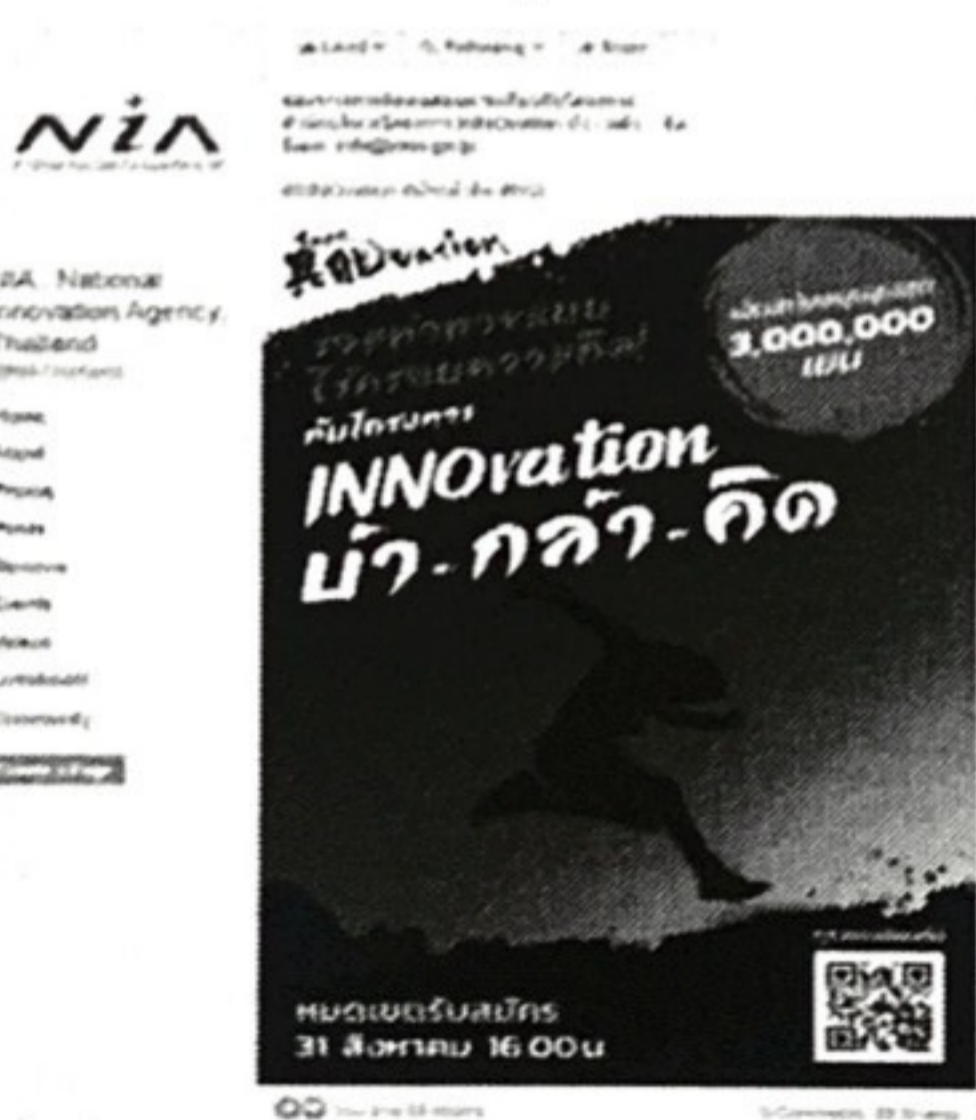
FB | NIA