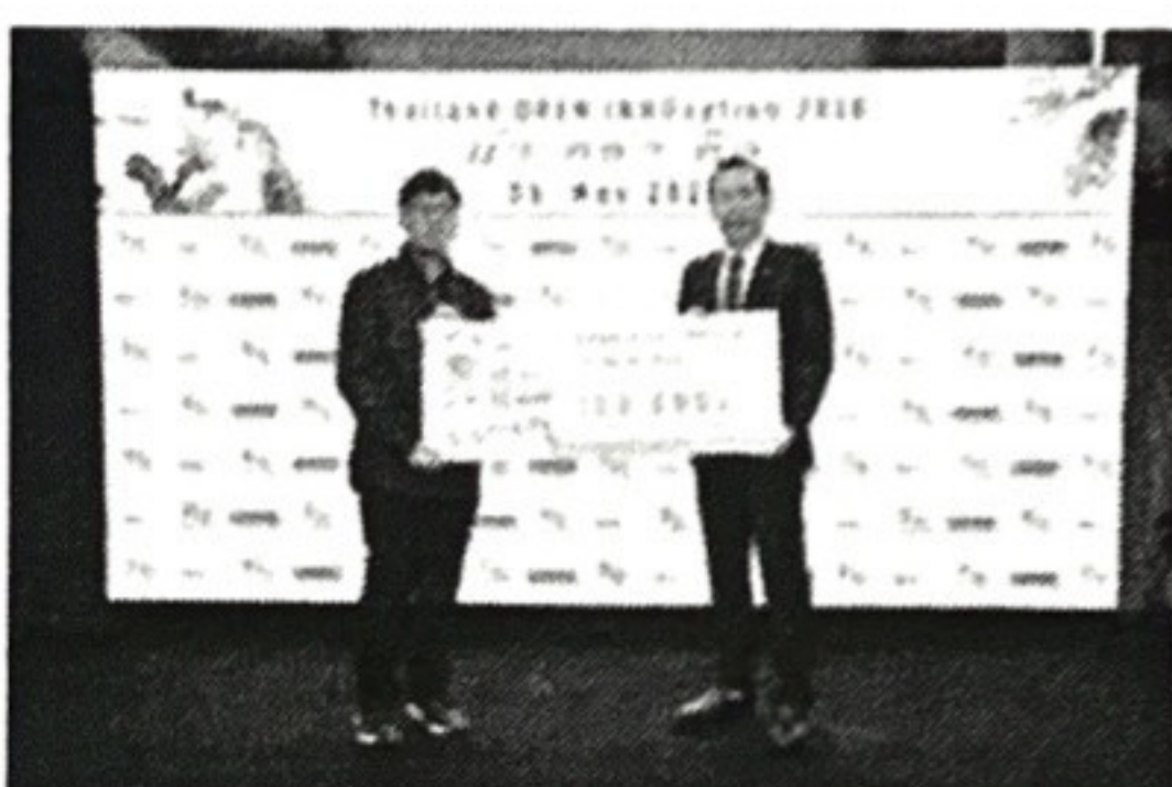
ผู้ได้รับรางวัลจาก DEPA