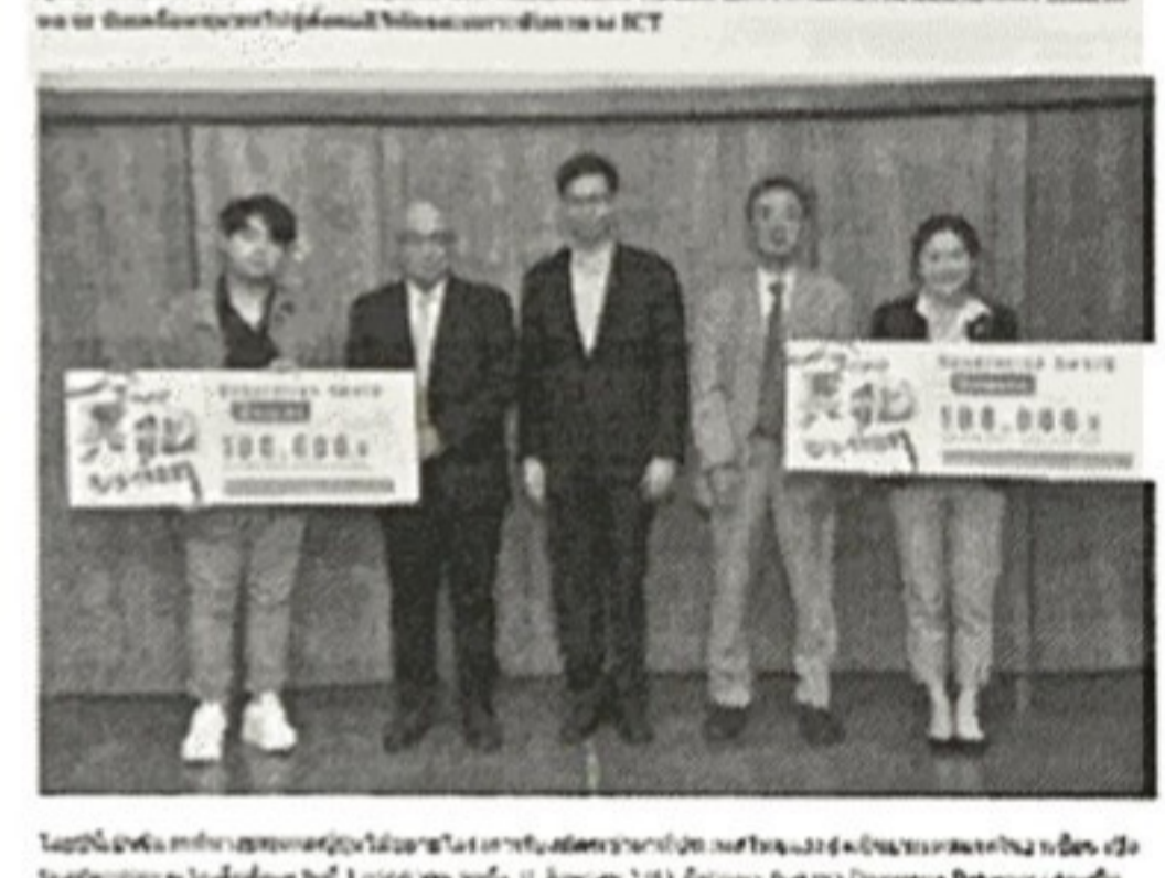
มอบรางวัลจาก Thailand Open INNOvation 2020 ... ได้รับรางวัลชนะเลิศ ...