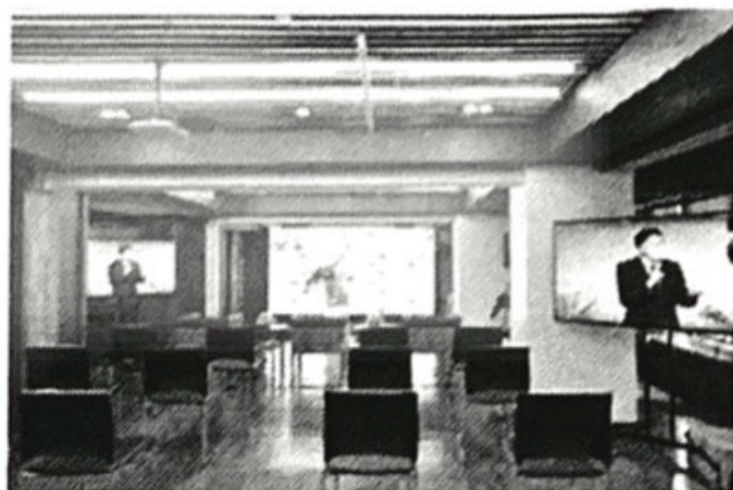
สถานที่จัดงาน