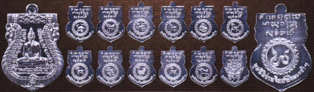
เหรียญเนื้อเงิน บุษบาเหรียญละ 1,800 บาท