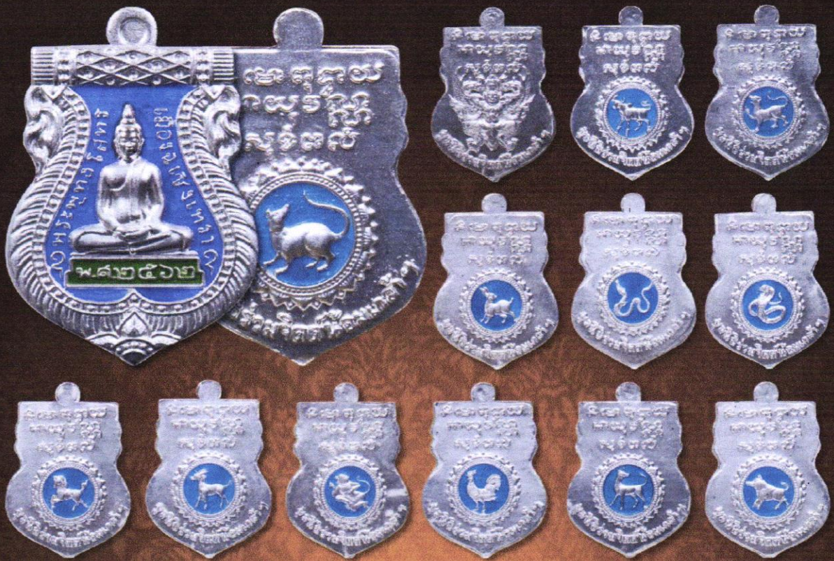
เหรียญเนื้อเงินลงยา บูชาเหรียญละ: 2,000 บาท