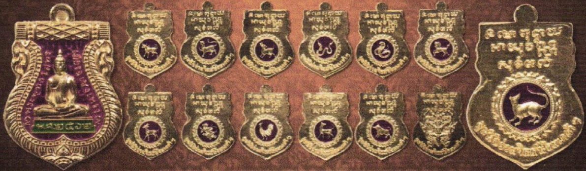
เหรียญเนื้อทองคำลงยา บุษบาเหรียญละ 48,000 บาท