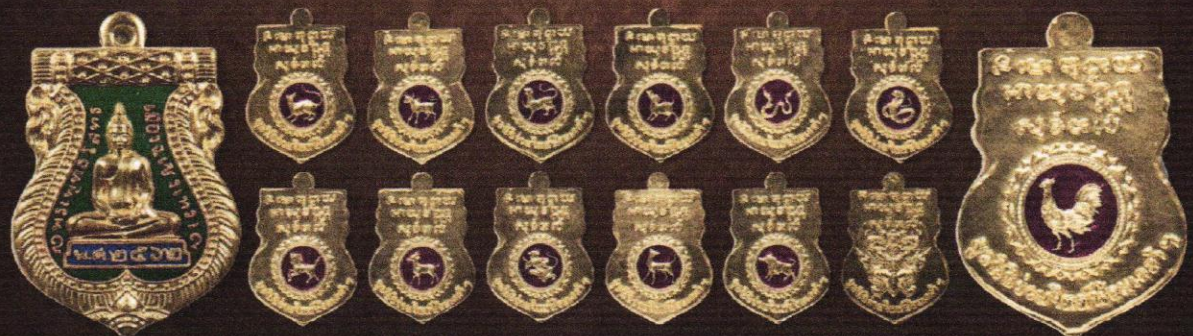
เหรียญเนื้อทองแดงชุบทองลงยา บูชาเหรียญละ: 350 บาท