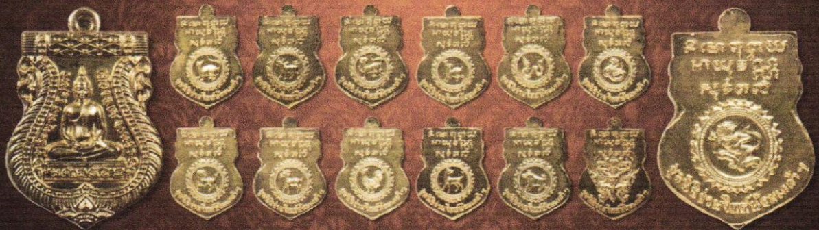
เหรียญเนื้อทองแดงชุบทอง บูชาเหรียญละ: 200 บาท