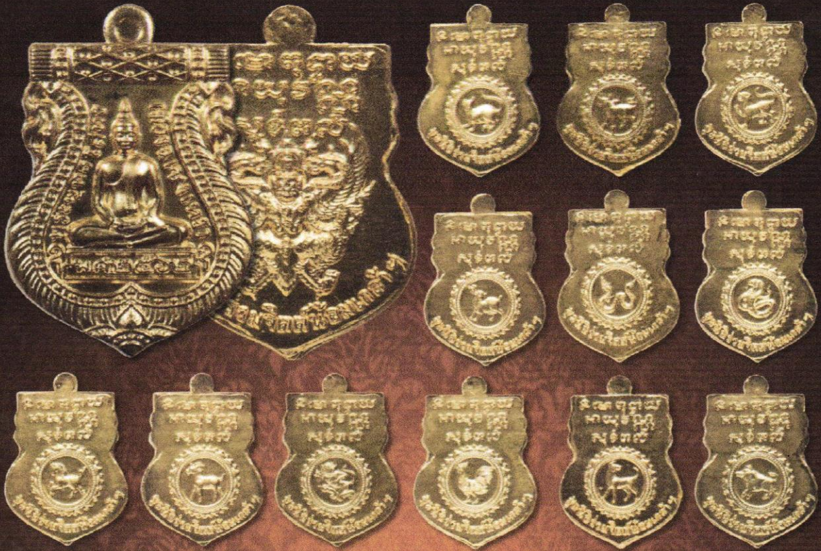
เหรียญเนื้อทองคำ บุษบาเหรียญละ 46,000 บาท