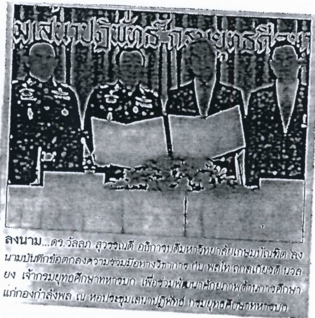
ลงนาม...ดร.วัลลภ สุวรรณดี อธิการบดีมหาวิทยาลัยเกษมบัณฑิต ลงนามบันทึกข้อตกลงความร่วมมือทางวิชาการ กับ พลโท จกตเกียรติ นวลยาง เจ้ากรมยุทธศึกษาทหารบก เพื่อร่วมพัฒนาศักยภาพด้านการศึกษาแก่กองกำลังพล ณ หอประชุมเสนาบดีวิบูลย์ กรมยุทธศึกษาทหารบก