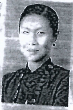
กอบกาญจน์ วัฒนาราม

คุณอ็อลและ รัฐมนตรีกระทรวง ทบแล้ว ว่างจนการท่องเที่ยวเป็นหัวใจสำคัญในการนำพาประเทศไทยซึ่งรัฐบาลเอทีกันแนลให้การท่องเที่ยวเป็นยุทธศาสตร์ในการพัฒนาเศรษฐกิจและสังคมในขณะที่การท่องเที่ยวไทยภาคใต้จะปีสามารถนำรายได้ให้แก่ผู้ประเทศได้มากมาย