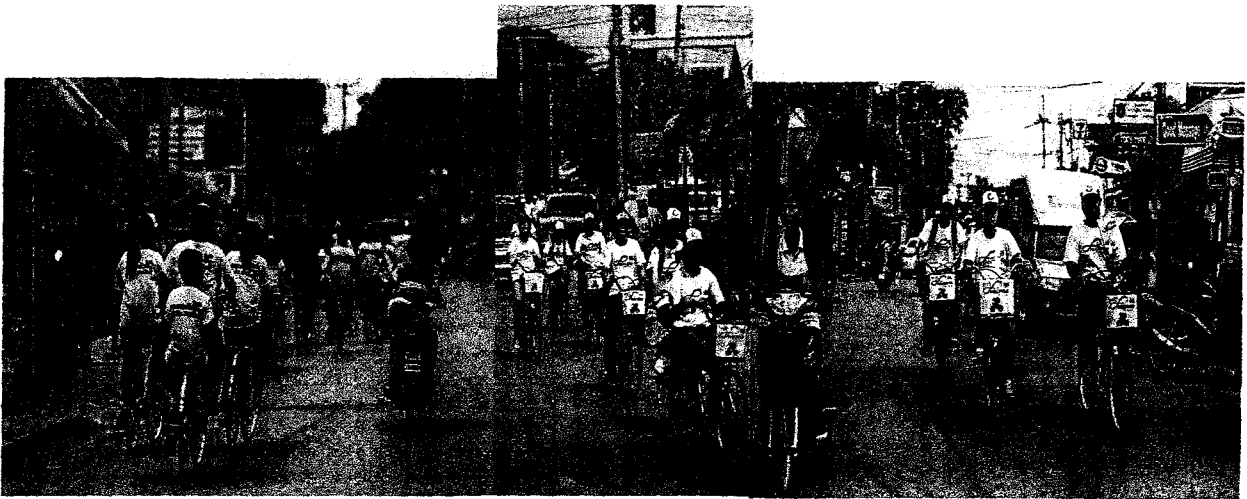
กิจกรรม “เดิน วิ่ง ปั่น เพื่อสันติภาพ”(peace road)