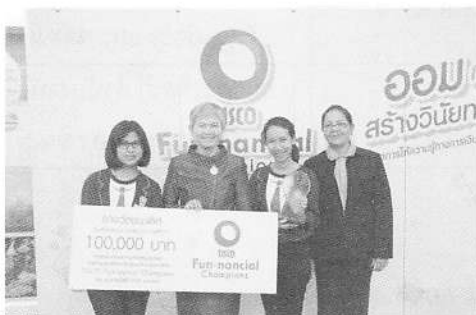
ทีมชนะเลิศการประกวดผลลัพท์กิจกรรมต่อยอด รุ่นที่ 4 โรงเรียนหาดใหญ่วิทยาลัย จ.สงขลา