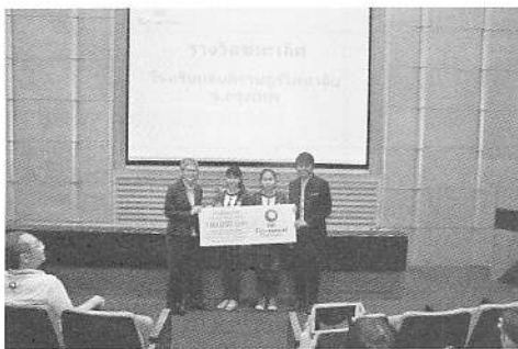
ทีมชนะเลิศการประกวดผลลัพท์กิจกรรมต่อยอด รุ่นที่ 3 โรงเรียนสันติราษฎร์วิทยาลัย จ.กรุงเทพมหานคร และ โรงเรียนเทพศิรินทร์เชียงใหม่ จ.เชียงใหม่