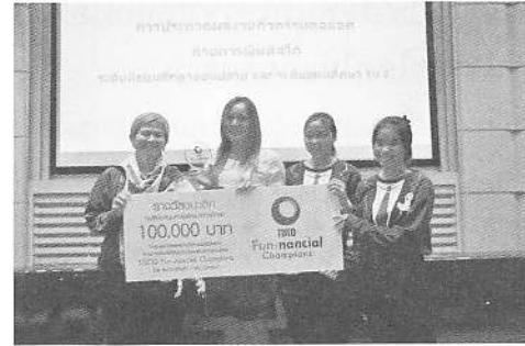
ทีมชนะเลิศการประกวดผลลัพท์กิจกรรมต่อยอด รุ่นที่ 2 โรงเรียนยางคำพิทยาคม จ.ขอนแก่น