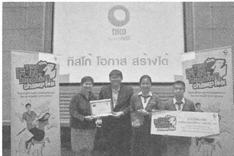
ทีมชนะเลิศการประกวดผลลัพท์กิจกรรมต่อยอด รุ่นที่ 1 โรงเรียนเทพศิรินทร์เชียงใหม่ จ.เชียงใหม่