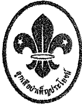
ชั้นที่ ๒