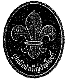
ชั้นที่ ๓